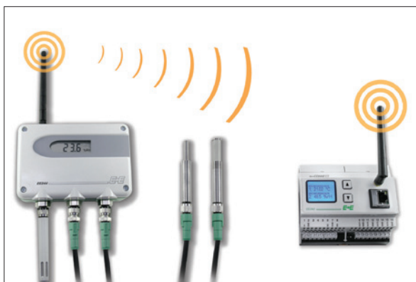
Obr. 1. K převodníku EE240 (vlevo) lze kabelem připojit až tři nezávisle pracující inteligentní senzory (uprostřed); bezdrátově lze převodník připojit k základnové stanici (vpravo), která je určena k zapojení do firemní sítě

Pro rozšíření sítě nebo pro překonání překážek jsou dostupné bezdrátové směrovače (routery).