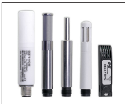
Obr. 2. Výměnné senzory pro připojení k převodníku řady EE240

Převodník EE244 může být vybaven až třemi nezávislými senzory. Je napájen z baterií s životností až tři roky. Při energeticky náročnějším měření je možné použít standardní adaptér pro napájení z elektrické sítě.