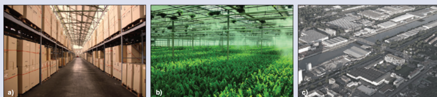
Obr. 3. Bezdrátové převodníky EE240 se uplatní v obtížných prostředích: a) ve skladech, b) ve sklenících, c) v průmyslu

Železnice, řeky a dálnice jsou jen několika málo příklady překážek, které jsou pro kabelové převodníky velmi obtížně překonatelné. Bezdrátové převodníky EE240 lze do takto obtížných terénů instalovat velmi snadno.